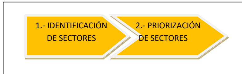
Gráfico N° 1: Subprocesos del Proceso de Focalización

El proceso de focalización, consta de dos (02) subprocesos consecutivos, según: